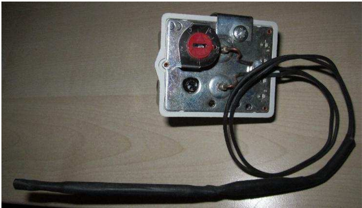
Thermostat mono double bulbe : 1 bulbe réglé réglable; 1 bulbe sécu réarmable.