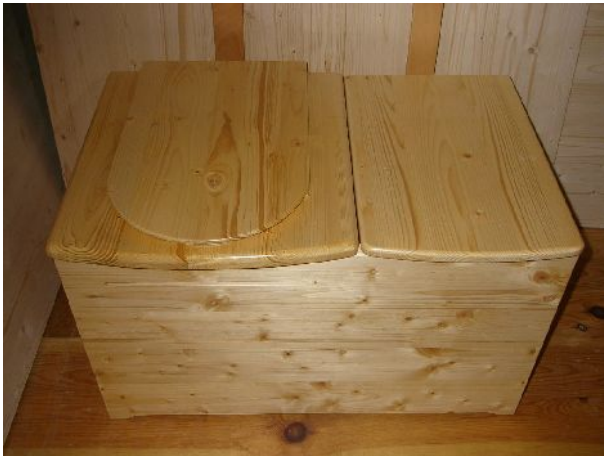
Toilette en pin du Nord avec réservoir à droite

Les toilettes avec réservoir accolé sont intéressants sous de nombreux rapports :