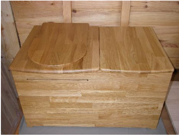
Toilette en chêne avec réservoir à droite